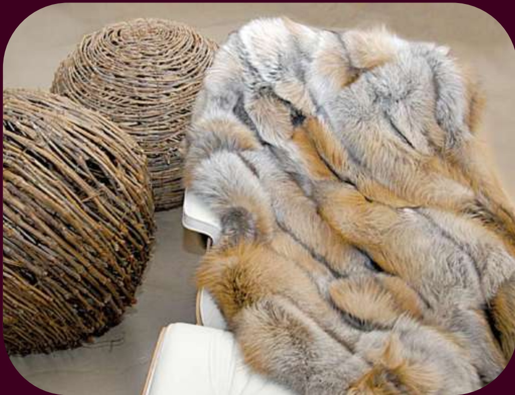
Originál kožešiny – liška