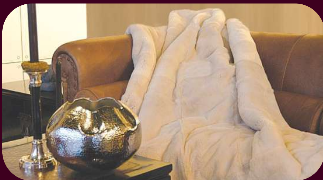
Originál kožešiny - králík