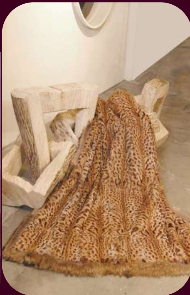
Originál kožešiny – králík