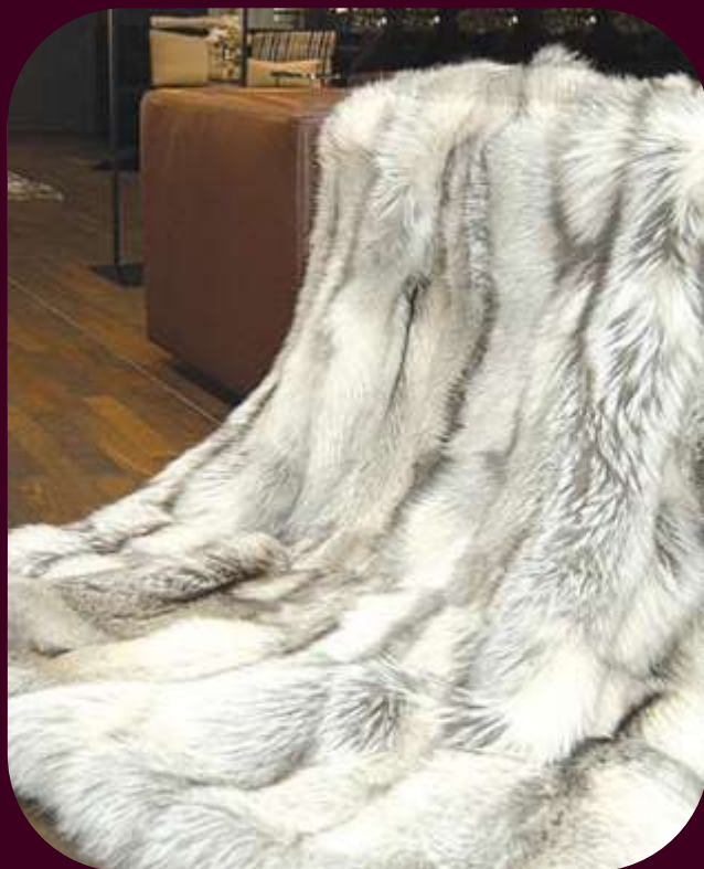
Originál kožešiny - liška